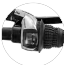
Drehgriffschalter mit Gang-Anzeige