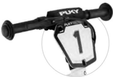
Nummerplate mit der Nummer 1